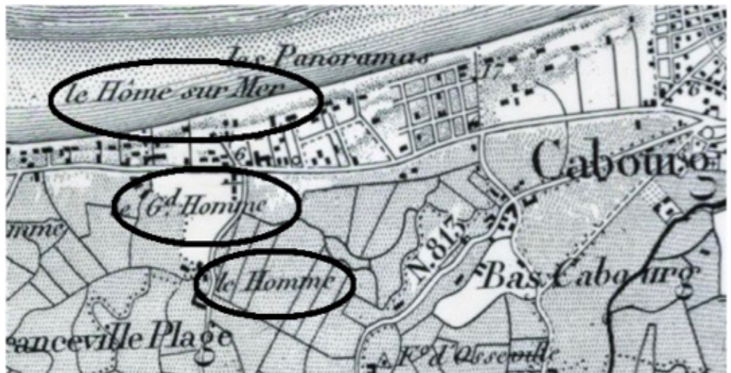
Carte IGN 1950