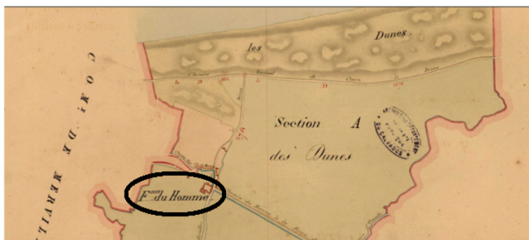
Cadastre 1826