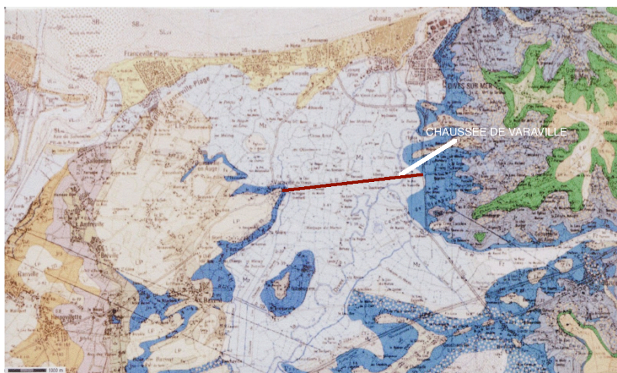
Carte géologique du BRGM où on distingue en jaune le cordon dunaire et en bleu ciel la partie sous l'eau à marée haute jusqu'à la chaussée de Varaville

En provenance de Barfleur où il a été construit, le bateau amiral de Guillaume, « Le Mora » attend dans la rade de Varaville. Il doit appareiller pour Saint-Valéry, dans l'estuaire de la Somme où toute la flotte a rendez-vous pour la traversée de la Manche.