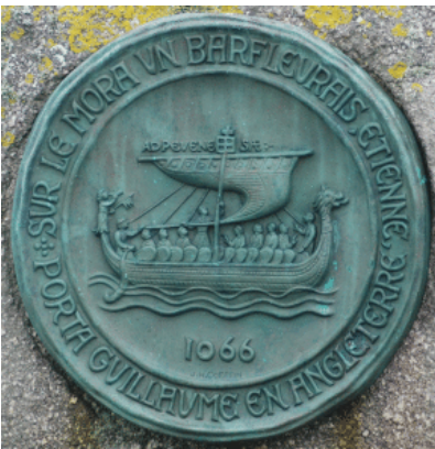
Extrait de la tapisserie de Bayeux

Cet immense rassemblement prend fin le 12 septembre 1066 peu avant l'aube avec l'appareillage de la flotte pour Saint Valéry dans l'estuaire de la somme. Une longue attente de vents favorables s'ensuit.